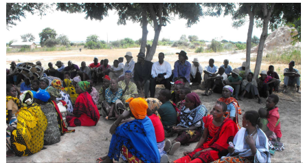
Moja ya mikutano ya uhamasishaji ngazi ya kitongoji-Kitongoji cha Chang'ombe, Manyoni

Hatua hizo ndizo zilizofanyika katika wilaya kumi na mbili zilizowezesha na MKURABITA kupitia utaratibu wa Kijiji Darasa kama vile Mbondo (Nachingwea) Sajaranda (Manyoni), Kyankoma na Nyakiswa (Musoma),