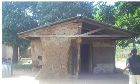
Ofisi ya Kijiji cha Namatunu, Nachingwea. Vijiji vingi havina ofisi na zilizopo ziko katika hali mhava

Timu za wilaya na kata zikongozwa na timu ya MKURABITA hufanya ziara ya kutembelea na kubaini kwa undani vijiji vilivyopendekezwa na halmashauri ya wilaya kuhusika na utekelezaji wa Mpango, lengo likiwa ni kupata uzoefu na ufahamu zaidi juu ya vijiji husika, kuangalia kijiji kinachofaa kutumika kama kijiji darasa (practicum village), pamoja na kujua miundo mbinu iliyopo na mf. Ofisi za serikali za vijiji na masjala ya ardhi ya kijiji. Pia timu hizo hufanya mikutano ya uhamasishaji katika ngazi ya kitongoji na vijiji ili kufikisha wananchi walio wengi.