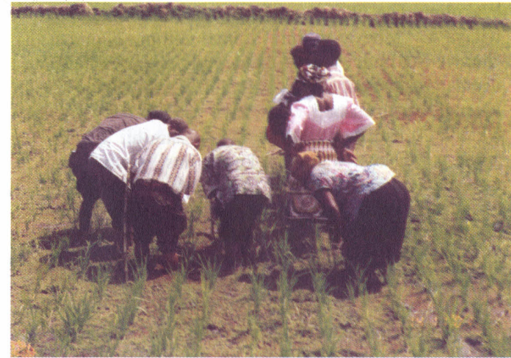
Picha hii inawaonesha wakulima wakiangalia vitalu vya mpunga na aina za mpunga