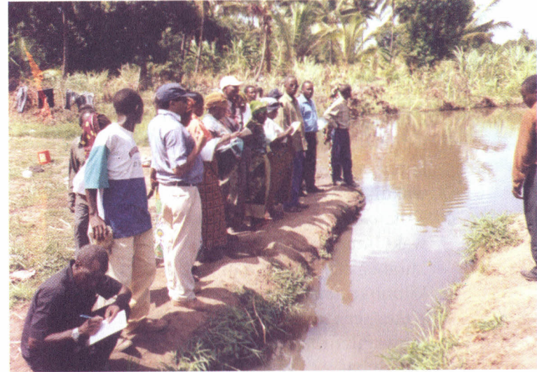
Picha hii inawaonesha wakulima wakiangalia mifereji ya umwagiliaji katika mashamba ya mpunga