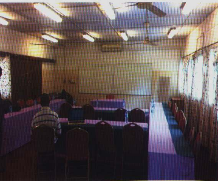
Mojawapo ya kumbi za mikutano

Wakala una kumbi nzuri za kufanyia semina mbalimbali ambazo zimekuwa kivutio kwa watu wengi kutokana na utulivu na madhari ya eneo la wakala. Bei ya kumbi ni nzuri na inavutia wateja wengi hasa wale wanaofanya shughuli za kiserikali.