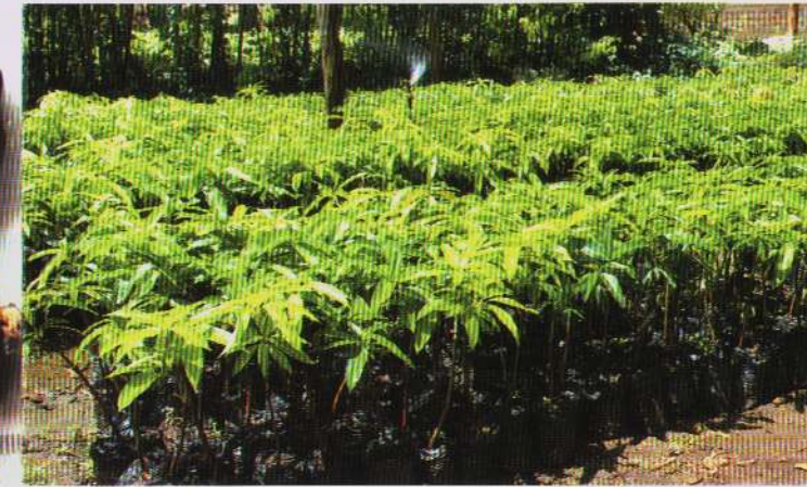
Miche ya miembe iliyoboreshwa toka TTSA

Aidha wakala unazalisha miche ya miti ya asili na kigeni kwa matumizi mbalimbali. Baadhi ya aina ya miche inayozalishwa na wakala ni pamoja na Mninga, Mkongo, Mpingo, Mvinje, Mtiki, Mvule, Mkangazi, Mwalambe na kadhalika kufanya maandalizi ya kuzikusanya kwani mbegu nyingi hazihifadhiwi kwenye magala kama zilivyo mbegu za mazao ya kilimo.