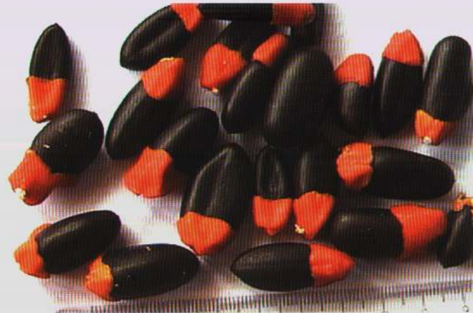
Afzelia Quanzensis Seed

Kuwa kituo bora na cha kuigwa katika kuzalisha na kusambaza mbegu bora za miti na vipandikizi vingine katika kanda ya Afrika mashariki na kati.