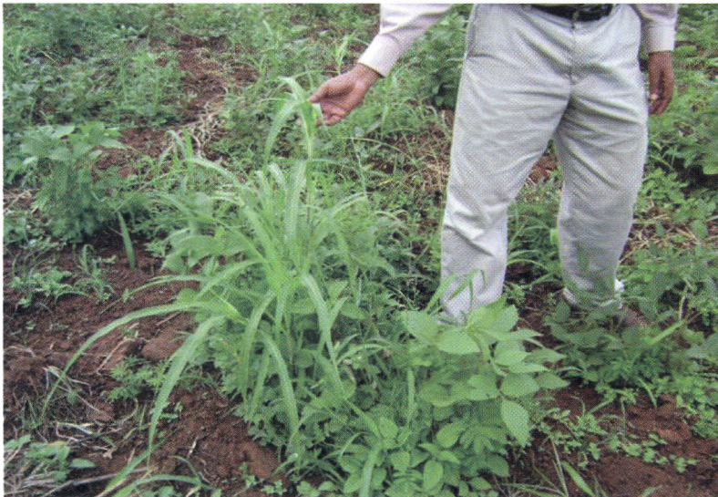
Kielelezo na. 4 Magugu yanavyoweza kushindana na kuidumaza soya iliyoko shambani