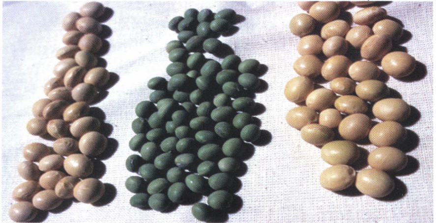
Kielelezo na. 2 Aina mbali mbali za soya

Kuna aina mbalimbali za mbegu za soya ambazo zimefanyiwa utafiti hapa nchini. Mbegu hizo ni kama 3H/l, 7H/101, Kaleya, Duicker, Ex-Laela (CR), Ex-Laela (BR) Ezumu-Tumu, n.k. Mbegu aina ya Bossier ni mbegu ambayo imekuwepo hapa Tanzania kwa muda mrefu. Mbegu hii inalimwa katika mikoa yote na vile vile inaendelea kufanyiwa utafiti kama kielelezo ( standard check ) kwa kulinganisha na mbegu mpya za aina nyingine kama inavyooneshwa katika jedwali. Mbegu aina ya 3H/l, 7H/101, Kaleya, Duicker na Bossier hustawi zaidi kwenye nyanda za kati (mita 300 hadi 1,400).