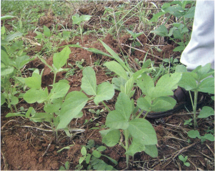
Kielelezo na. 3

Siku 14 hadi 21 baada ya soya kupandwa ni vema zao lipaliliwe. Vile vile zao hili lipaliliwe tena mara linapoanza kutoa maua. Hivyo palilia shamba lako mapema iwezekanavyo na mara kwa mara ili upate mavuno mengi. Usishangae ukalazimika kupalilia soya zaidi ya mara mbili hasa kama shamba lina magugu mengi yasiyoweza kuondolewa kwa palizi mbili au kama palizi inalazimika kufanyika wakati kuna mvua ambayo inasababisha magugu yasikauke, au kuoza haraka.