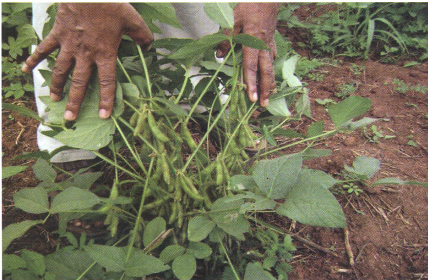
Kielelezo na. 6 Soya iliyokomaa ikisubiri kukauka na kuvunwa

Mkulima anashauriwa kupanda mbegu sahihi ama sivyo mbegu kama ya muda mrefu inaweza kuanza kutoa maua wakati mvua inaishia na hivyo kusababisha mbegu changa zilizozaliwa kushindwa kukomaa..