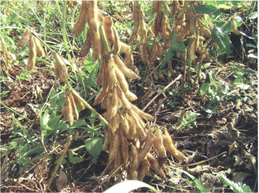
Kielelezo na. 7 Soya iliyokauka ikisubiri kuvunwa

Kama soya haikuvunwa mapema kwa kungojea matunda ya mmea wote yaive na kukauka shambani, maganda ya matunda yake hupasuka na mbegu nyingi kupotea shambani. Hivyo ni vyema mkulima awe makini sana wakati wa uvunaji wa soya ili kupunguza upasukaji wa maganda ya matunda na upotevu wa mbegu.