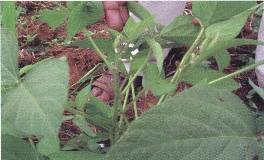
Kielelezo na. 5 Soya inayotoa maua

Ukuaji wa soya unafuatwa na kutoa maua muda unapofikia. Muda huu unategemea kama soya ni ile mbegu ya muda mfupi au mrefu. Ikiwa ya muda mfupi, maua yanaanza kuonekana inapokaribia miezi miwili tangu ipandwe. Mbegu ya muda mrefu inachukua zaidi ya miezi miwili na nusu kabla maua hayaanza kuonekana.