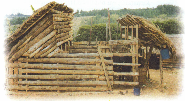
Picha hii ni mfano wa nyumba bora za mifugo zenye gharama nafuu. Picha ilichukuliwa huko Itulike, Njombe.