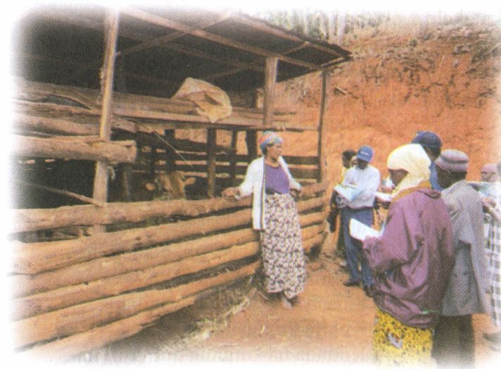
Picha hii inamwonyesha mkulima wa Lushoto akitoa maelezo kwa wageni wake kutoka nyanda za Juu Kusini kuhusu ufugaji bora, utunzaji na matumizi bora ya samadi shambani