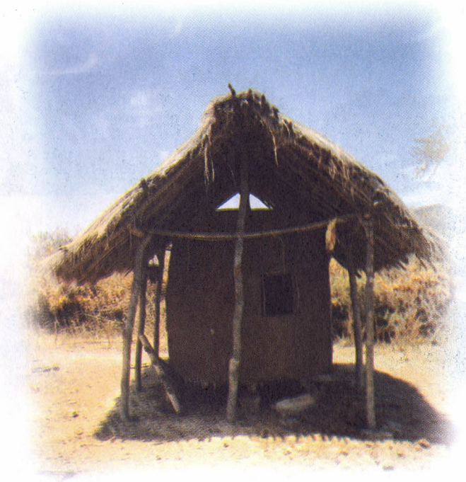
Picha hii inaonyesha kihenge cha kuhifadhia mazao, kama njia mojawapo ya kuboresha uhakika wa chakula. Picha ilichukuliwa kwa mkulima wa Mbarali.

walishirikiana na wenzao wa Kanda ya Nyanda za Juu Kusini.