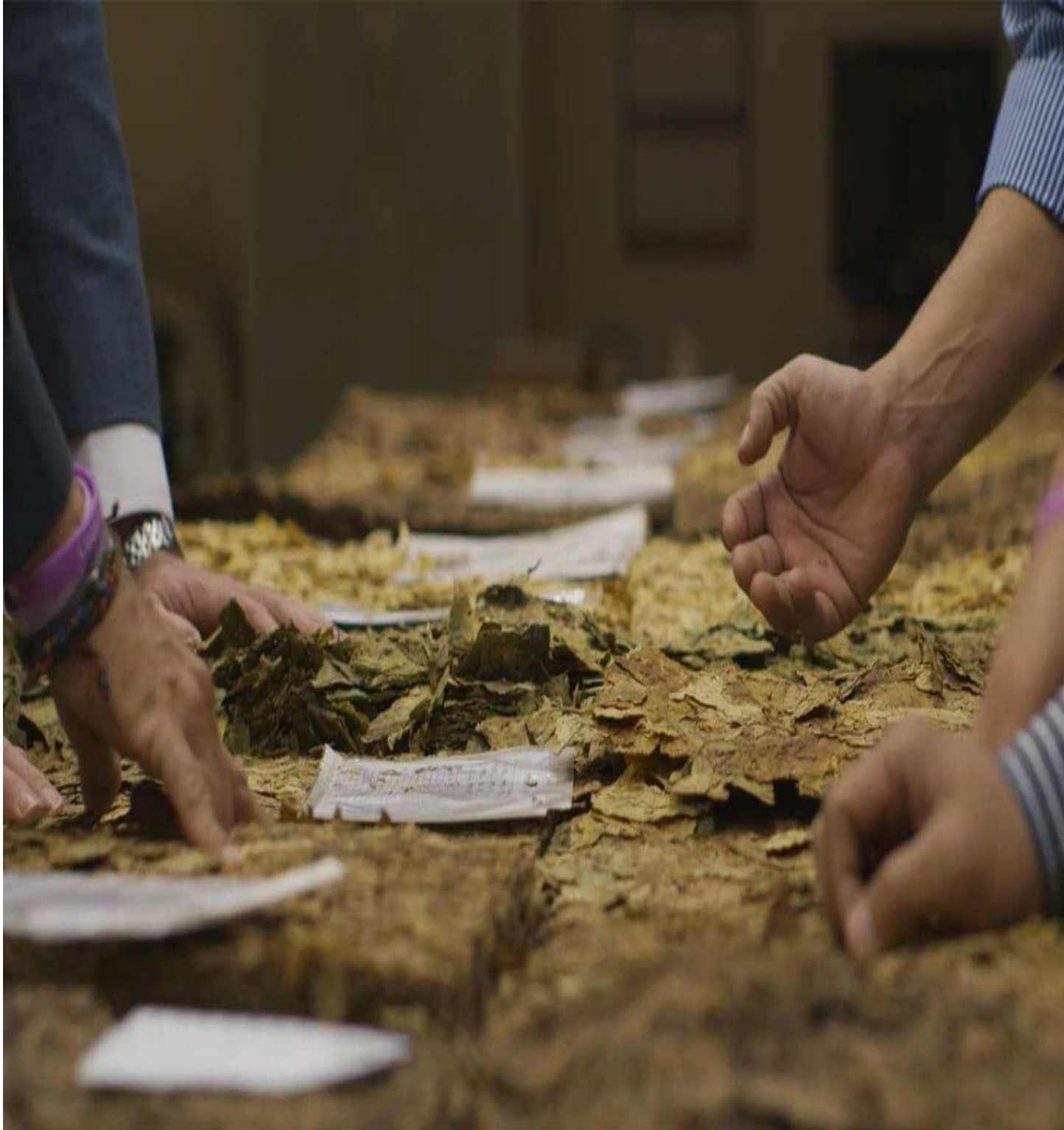
Odyssey ya jani la tumbaku