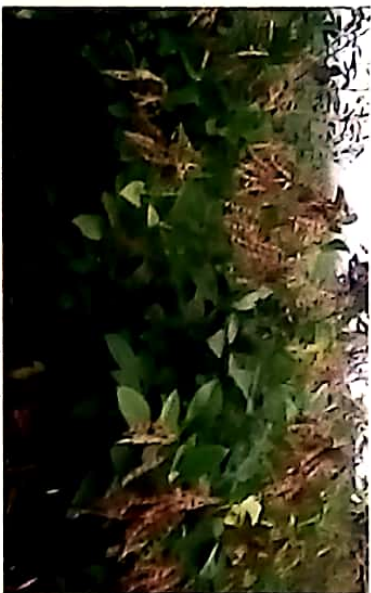
Mbaazi iliyokomaa tayari kwa kuvunwa

Vuna wakati mbaazi zimekomaa vizuri vitumba vinapobadilika kuwa na rangi ya kahawia. Vuna kila baada ya siku 3 hadi 5 kwa kuchuma vitumba au kukata matawi. Kausha juani, piga na kupeta.