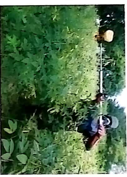
Unyunyiziwi wa kiuwadudu shambani

kukomaa. Viuwadudu vinavyofaa ni Karate, Amerate, Profecron, COLT (chlorpyrifosi), au nyingine utakayoshauriwa na mtaalamu wa kilimo.