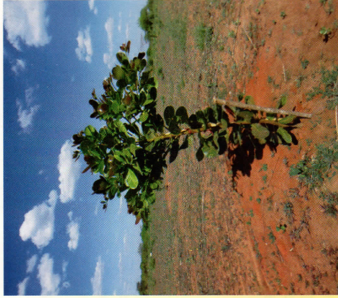
Mkorosho mchanga uliopogolewa vizuri wakati wa kukua unategemewa kutoa mazao mengi