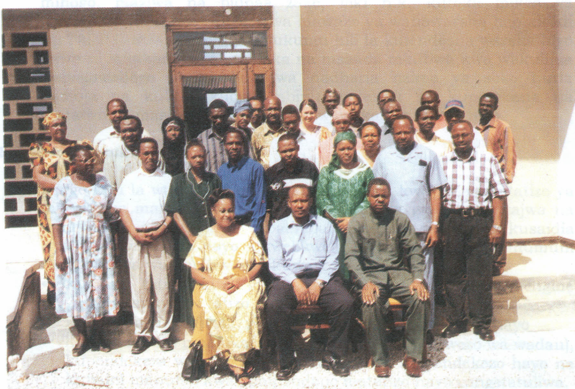
Washiriki wa Warsha wakiwa kwenye picha ya pamoja