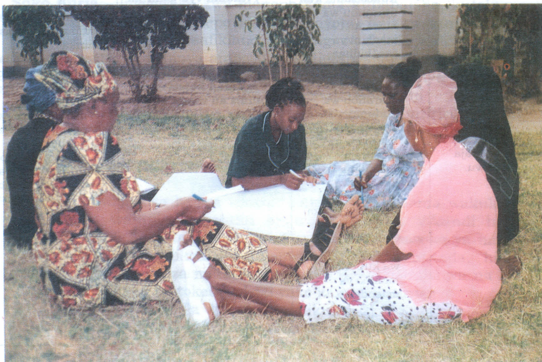
Kikundi cha wakulima wanawake wakiwa katika zoezi la kutambua visababishi vya matatizo ya masoko ya mazao