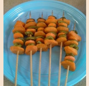
Mishikaki ya viazi lishe