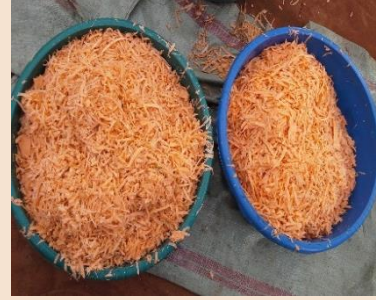
Chipsi za kutengeneza unga