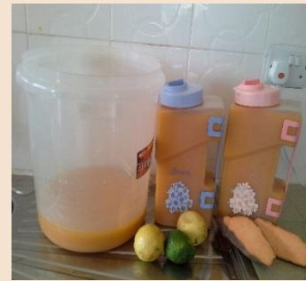
Juisi ya vaizi lishe