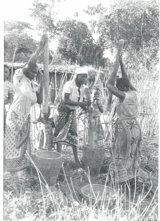
Akina mama wanatwanga uwele.

Bei ya zao la ulezi ni mara mbili ya bei ya nafaka nyingine. Faida nyingine ya kilimo cha zao la ulezi ni kwamba halihitaji gharama yoyote