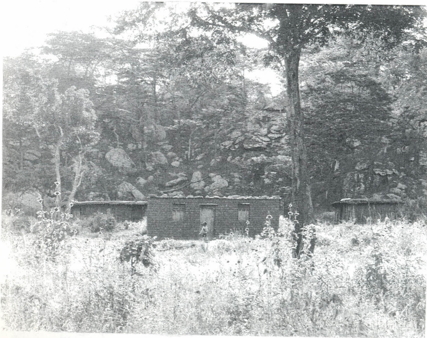
Katika eneo la Madah wakazi wamejenga nyumba zao karibu na miamba ya mawe na kutumia maeneo ya mabondeni kwa shughuli za kilimo. Nyumba hizo zinatengeneza mpaka kati ya wanyama pori wanaoishi msituni na mashamba.

Kundi jingine la wahamiaji wa Madah ni Wabarabaig. Wao wanajitahidi kudumisha uhusiano wao na wilaya ya Hanang na pia wanahusiana na makundi mengine ya Wabarabaig yaliyosambaa katika sehemu mbalimbali za wilaya ya Kondoa na Babati. Sheria za makazi zilipoanza kulegalega wakati wa Oparesheni Vijiji mwishoni mwa miaka ya 1970, baadhi ya Wabarabaig walihamia hapo Madah. Baadaye Wabarabaig wengine walihamia hapo kutoka Bubu, Busi, Masange na sehemu nyingine katika jitihada za kutafuta mashamba na malisho ya mifugo yao.