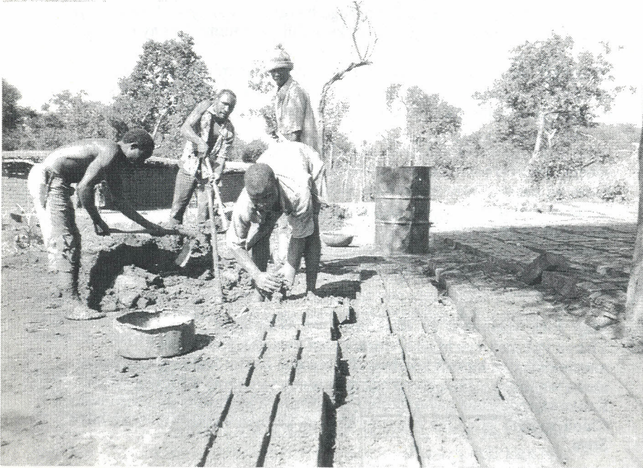
Ufyatuuji wa matofali kijijini Madah.

Watu wengi wazima wanaoishi Madah wameishi pia sehemu nyingine kabla ya kuhamia hapo. Kwa hiyo ni rahisi kwao kulinganisha hali ya maisha ya hapo Madah na ya hizo sehemu nyingine. Kwa sababu wengi wa wahamiaji wa Madah wanatoka katika sehemu zilizokumbwa na uharibifu mkubwa wa ardhi sio ajabu kusikia watu hao wanaisifia sana Madah.