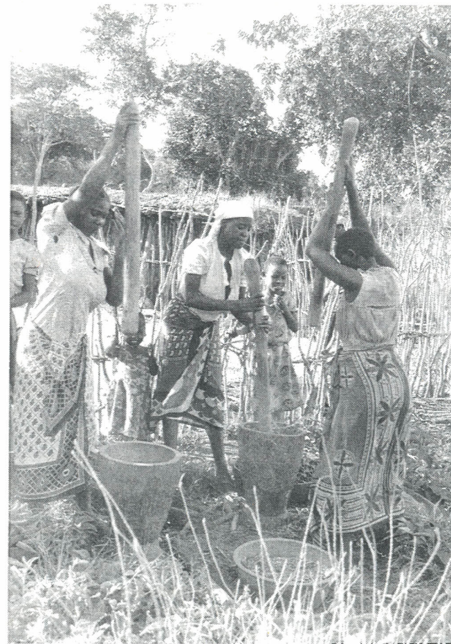
Akina mama wanatwaga uwele.

Bei ya zao la ulezi ni mara mbili ya bei ya nafaka nyingine. Faida nyingine ya kilimo cha zao la ulezi ni kwamba halihitaji gharama yoyote